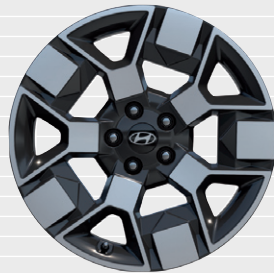
mit DESIGN Pack Leichtmetallfelgen 19" 235/45 R19 Nexen